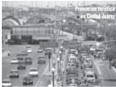
Promoción turística en Ciudad Juárez

que se dieron cita el pasado año. También se prevé la participación de más de mil mayorista y agentes de viajes, así como superar la cifra de 18 mil 588 citas de negocios preestablecidas en 2007.... Mientras tanto, en Ciudad Juárez , El Diario informó que líneas aéreas aportarán este año al menos tres millones de pesos más para