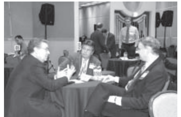
Encuentros para iniciar nuevos negocios México-Estados Unidos.