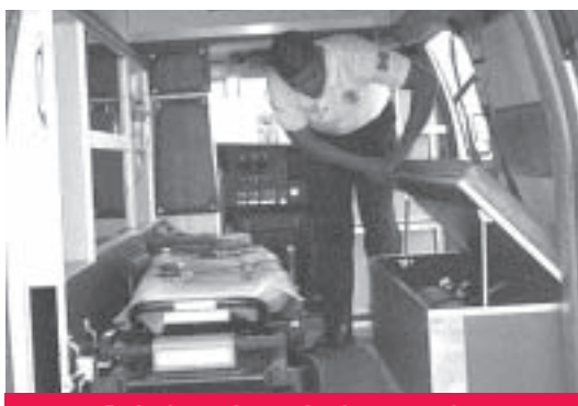
Equipada para la atención de emergencias.

Estas acciones son permanentes. El año pasado, se recordó durante el acto, el aeropuerto de Monterrey donó también al municipio de Apodaca una patrulla nueva que actualmente vigila la vía rápida a la terminal aérea.