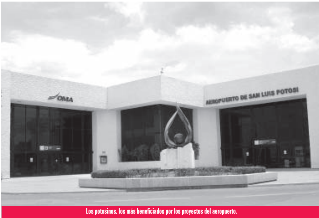
Los potosinos, los más beneficiados por los proyectos del aeropuerto.

En la conferencia se dieron cita más de 200 participantes, entre representantes gubernamentales y empresarios. Ahí estuvieron personalidades como el secretario de Comercio de Estados Unidos, Carlos M. Gutierrez; y los secretarios de Comunicaciones y Transportes, Luis Téllez; de Hacienda y Crédito Público, Agustín Carstens; de Energía, Georgina