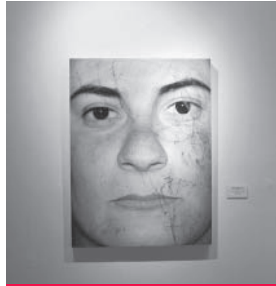
"Ivonne", de Rafael Rodríguez.

Esta organización se encarga promover una convocatoria a nivel nacional en el área de artes plásti-