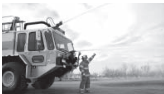
Los bomberos se someten a un intenso programa de capacitación que incluye la operación de equipos motores.

CREI de Excelencia tiene como misión estar siempre en guardia para lograr el rescate de personas, salvaguardando sus vidas y bienes en los casos de accidentes e incidentes de aviación y de emergencias en el aeropuerto.