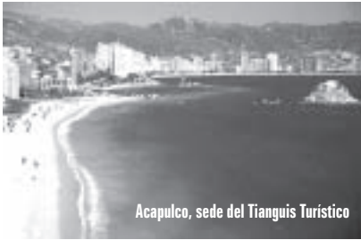
Acapulco, sede del Tianguis Turístico