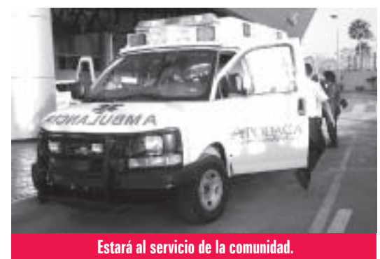
Estará al servicio de la comunidad.

Como parte del Programa Buen Vecino, el aeropuerto de Monterrey donó una ambulancia último modelo y totalmente equipada, al municipio de Apodaca, para ser utilizada en labores de atención a la comunidad.