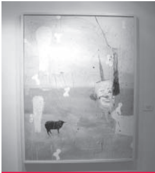
"El ancho del círculo", de Francisco Larios.

Nuevamente el aeropuerto de Monterrey abrió sus puertas para exhibir arte contemporáneo de jóvenes artistas que han participado en la Bienal Monterrey FEMSA y cuyas obras más destacadas se integrarán o están en proceso de integrarse a la Colección FEMSA.