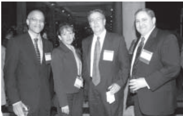
Directivos de la Agencia de Comercio y de OMA.

En el marco de este evento, USTDA formalizó la aportación de 1.7 millones de dólares para la elaboración de estudios de factibilidad técnico-económico-ambiental de cinco proyectos, tres de