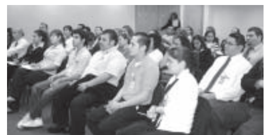
Los locatarios se capacitan para servir mejor a sus clientes.

El curso tuvo una nutrida asistencia y participación de responsables de los diferentes giros de los locales comerciales que se encuentran en el aeropuerto. Para seguir mejorando los estándares de atención a los clientes y calidad en el servicio, la capacitación continuará, como parte de la misión y visión de OMA en todos sus aeropuertos.